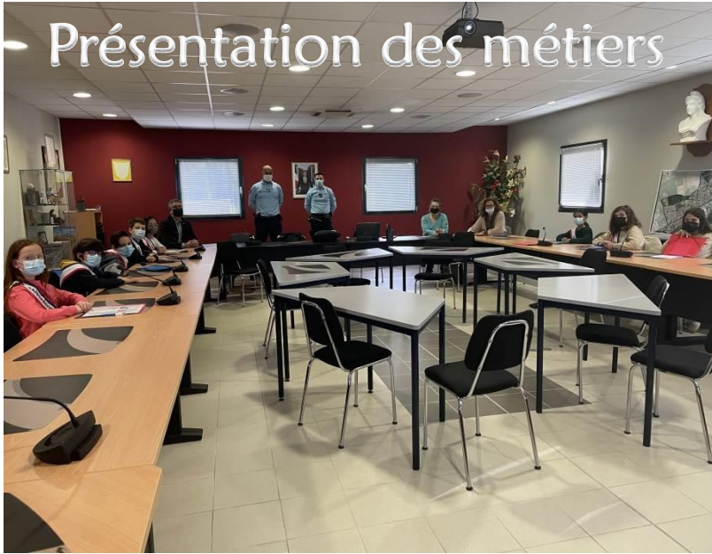
Présentation des métiers